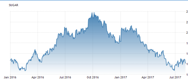
شکل شماره ۲: نمودار جهانی شکر (۱ ساله)

طبق انتظارات تحلیلی و مدل‌های ماکرو تجاری اقتصادی جهان، پیش‌بینی می‌شود شکر در پایان دوره این فصل (سه ماهه سوم) در قیمت ۱۳,۸۰ سنت به ازاء هر پوند و در نگاهی رو به جلو، در بازه ۱۲ ماهه بطور میانگین در قیمت ۱۳,۴۰ سنت معامله گردد. (نمودار شماره ۴).