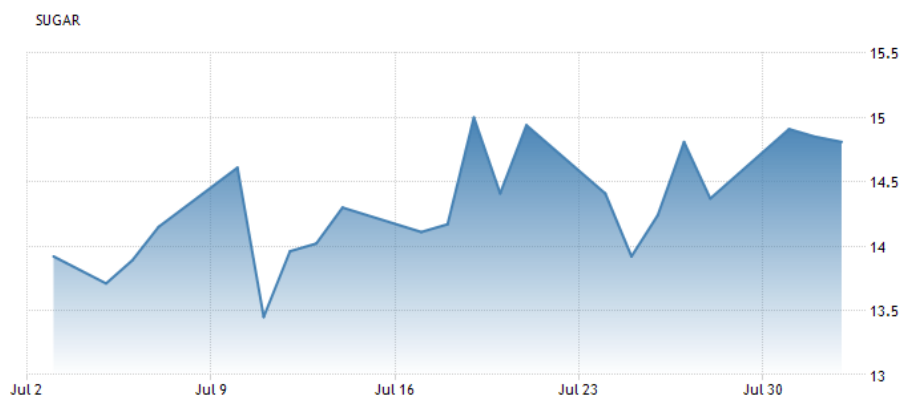
شکل شماره ۱: نمودار قیمت جهانی شکر در بازه زمانی یک ماهه

قیمت شکر خام بازار نزدیک نیویورک در بازه زمانی یک ماهه از حدود ۱۳,۹ سنت به ازاء هر پوند در ۳ جولای ۲۰۱۷، به حدود ۱۴,۹ سنت در ۲ آگوست ۲۰۱۷ افزایش یافته است (نمودار یک ماهه شکل شماره ۱). همچنین در مقایسه با فصل قبل، که در قیمت ۱۵,۹ سنت به ازاء هر پوند معامله گردید، حدود ۱ سنت (به عبارتی ۶,۳ درصد) کاهش داشته است. بطور کلی قیمت در طول چند سال اخیر افت قابل توجهی را شاهد بوده است که بیشترین افت آن اواخر سال ۲۰۱۵ و اوایل ۲۰۱۶ بوده است (نمودار ۱ ساله و ۱۰ ساله، شکل‌های شماره ۲ و ۳). از لحاظ تاریخی نیز بیشترین رکورد قیمت شکر مربوط در نوامبر ۱۹۷۴ با قیمت ۶۵,۲۰ سنت و کمترین آن در ژانویه ۱۹۶۷ با قیمت ۱,۲۵ سنت ثبت گردیده است که این میزان تغییر قیمتی تنها در ۷ سال رخ داده است.