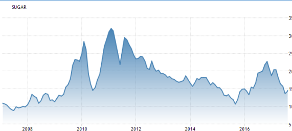
شکل شماره ۳: نمودار جهانی شکر (۱۰ ساله)